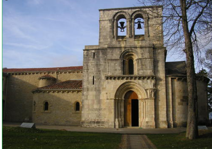
Iglesia Sta. María (Estibaliz)

El Patrimonio arquitectónico e histórico representa el pasado de una sociedad que permite conocer la personalidad de los pueblos que lo vivieron y que narra en cierta forma su experiencia histórica, tanto en los edificios originales como en las reformas o ampliaciones que algunos han podido sufrir a lo largo de los años.